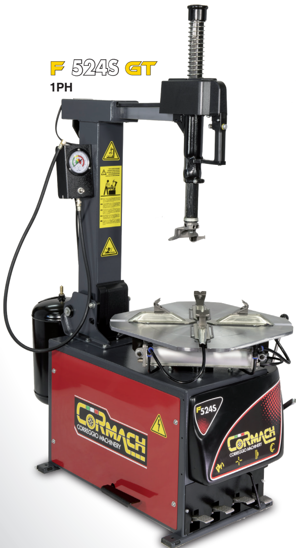
F 524S GT 1PH

ES Cilindro destalonador de doble efecto.