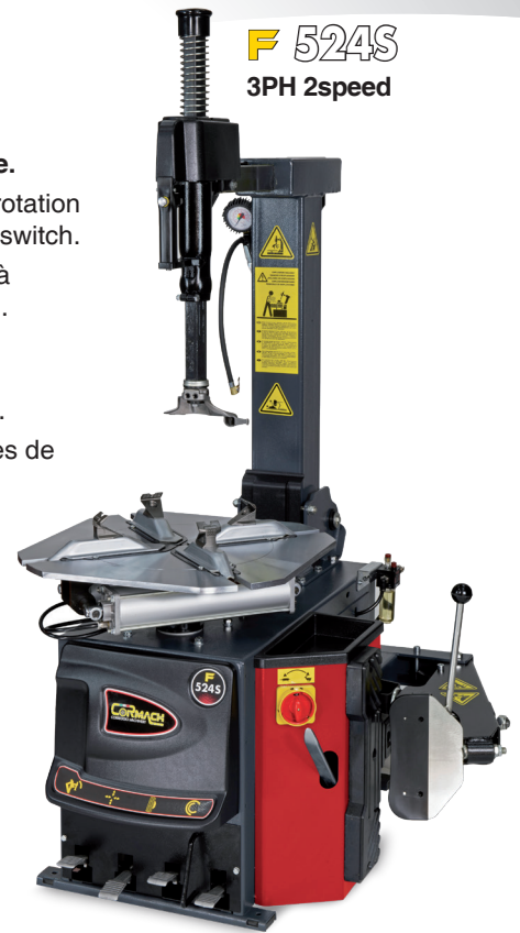
F 524S 3PH 2speed